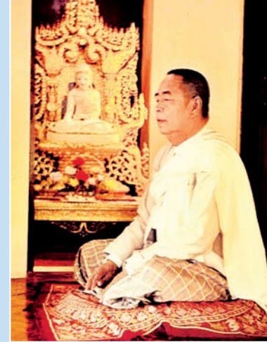
गुरुदेव विपश्यनाचार्य सयाजी ऊ बा खिन

1 या पॅंगोडाचे महत्त्व विशद करताना गोयंका हे प्रत्येक वेळेस म्यानमारची व विपश्यनाचार्य सयाजी ऊ बा खिन यांच्या ऋणांची आठवण करून देतात. यांच्यामुळे जगभरातील कोट्यवधी लोकांना ही विद्या शुद्ध स्वरूपात मिळाली. येणाऱ्या प्रत्येक पिढीला ही विद्या तिच्या शुद्ध स्वरूपात मिळवी यासाठी विपश्यनेत कोणत्याही प्रकारची मिलावट करू नये, असे आवाहनही गोयंका करतात.